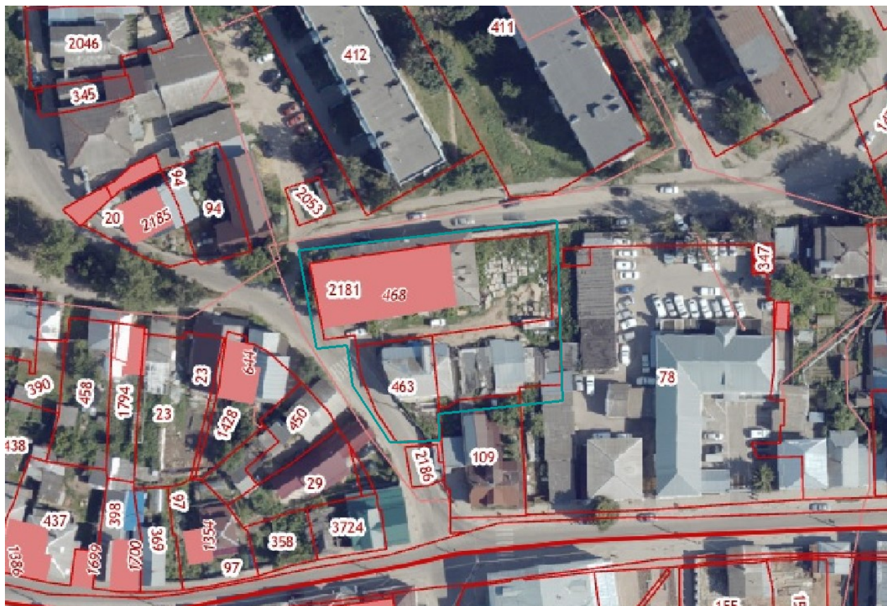
Схема границ подготовки проекта межевания территории